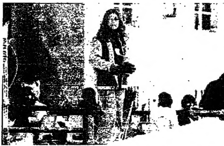
متزلجان في فترة استراحة في فاريا

كتب مروان عبدالله : بين فاريا وفترا توزع هواة الثلج امس بكثافة وفرح الاطفال الذين سئوا شوارعهم المختصرة ، والكبار الذين هجروا الى حيث لا مدينة ولا اختصار مسافات وانسان . داليدا كانت تغني امس «اضحك فانت الملك» . عمروا التسابل تحت الشمس وكتبوا باصابعهم بعض قصص حب او رستوا الشجر العماري والمعاصف التي لم تات امس الى مدينة الثلج . المهم انهم هناك يختصرون احزانهم ويحاولون الفرح ويستقرون بعض الغيم الطالع . وحده الانسان على حقيقته ، هندسة الاشكال تسقط ، ومن طبيعة آدم لم يبق الا هذا الشجر الذي يتراخي من بعيد ، وهذه الطرق التي تتسلل بين كوم الثلج وتضيق حيث تضيق مخلقة وراها بعض خطوط سوداء احلى ما فيها حياؤها المرتجل . « اضحك فانت الملك » . سكان الثلج امس مارسوا لعبة الملك وتذوقوا بعضهم بكرات الثلج . المخار يفقهون عندما تطال تذايقهم الكبار . على كل حال ، انها لعبة الملك . ورقصوا حتى الفرح ، زرعوا صدر الجبل خطوطا متشابكة كالمسام ، قرأوا وطمعوا مرات ومرات . حفروا لانفسهم ظللا تخاف القبة . المهم ان الحرب انتهت ، والسلام ات ولو على عربة يقودها طفل صغير وهم الان يعيشون فرح السلام ونعمة الثلج في وطن الثلج . القيم مر من تحت الجبل والمدينة في الفاع وهم على القبة . بينهم وبين المدينة والمضيق تلال من الغيم . والاستراحة كانت في فندق « فاريا الزار » .